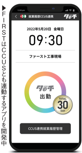
FIRSTはCCUSとも連動するアプリを開発中